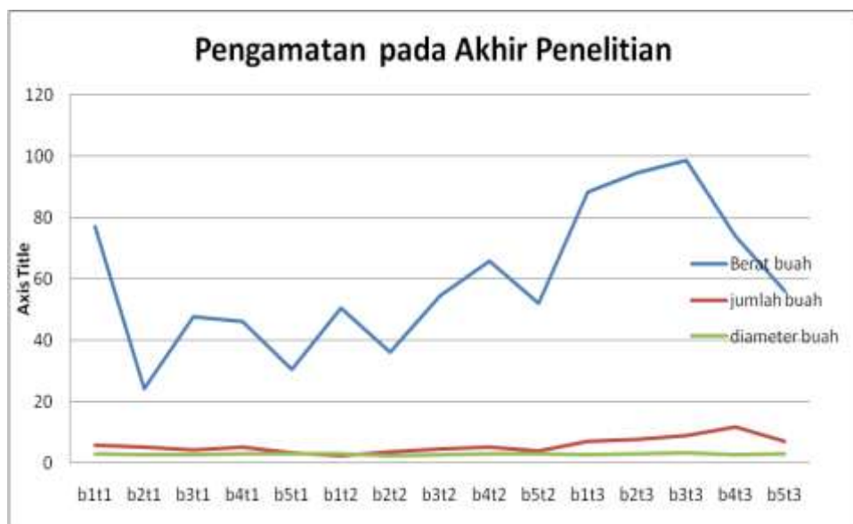
Gambar 2. Grafik pengamatan berat buah, jumlah buah, dan diameter buah

hara pada tanah gambut. Brady (1982) mengungkapkan bahwa ketersediaan unsur hara yang dapat diserap oleh tanaman merupakan salah satu faktor yang dapat mempengaruhi pertumbuhan tanaman.