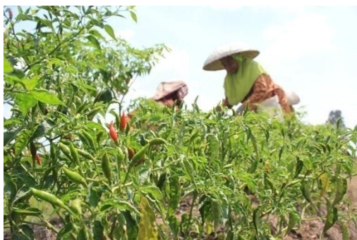
Gambar 1. usahatani cabe hiyung

Ada yang khas pada teknik persemaian mereka, yaitu “mangapal”. Mereka menyiapkan peti lain dan juga media dengan komposisi yang sama dengan media semai. Sebagian media dimasukkan ke dalam peti sampai sepertiga tinggi peti. Sisa media dibasahi dan digunakan untuk “mangapal”. Kegiatan “mangapal” dilakukan pada saat benih telah tumbuh